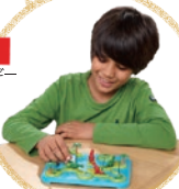
SMRT Games エスエムアールティ ゲームズ