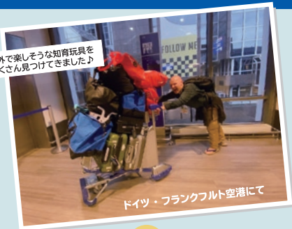
ドイツ・フランクフルト空港にて